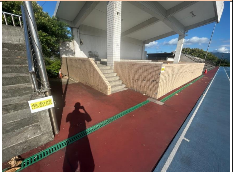
說明：組別位置分配