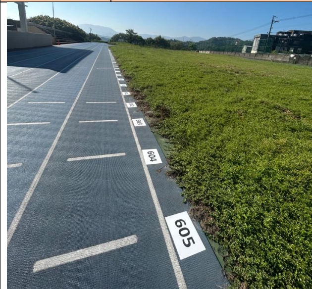
說明：地上貼有各班疏散位的標誌