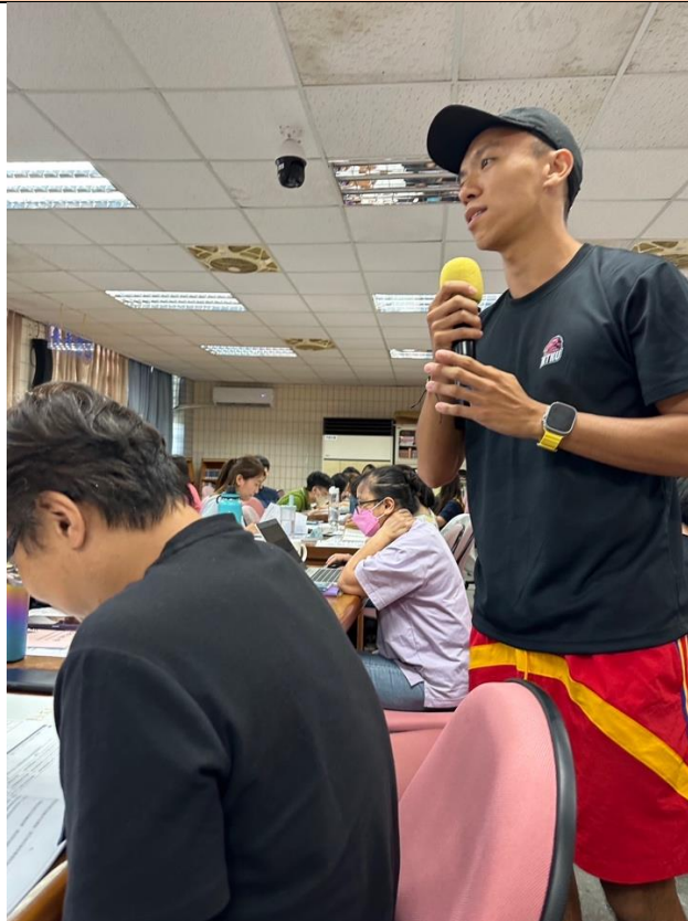
說明：校務會議與各處室及教師討論地震演練計畫