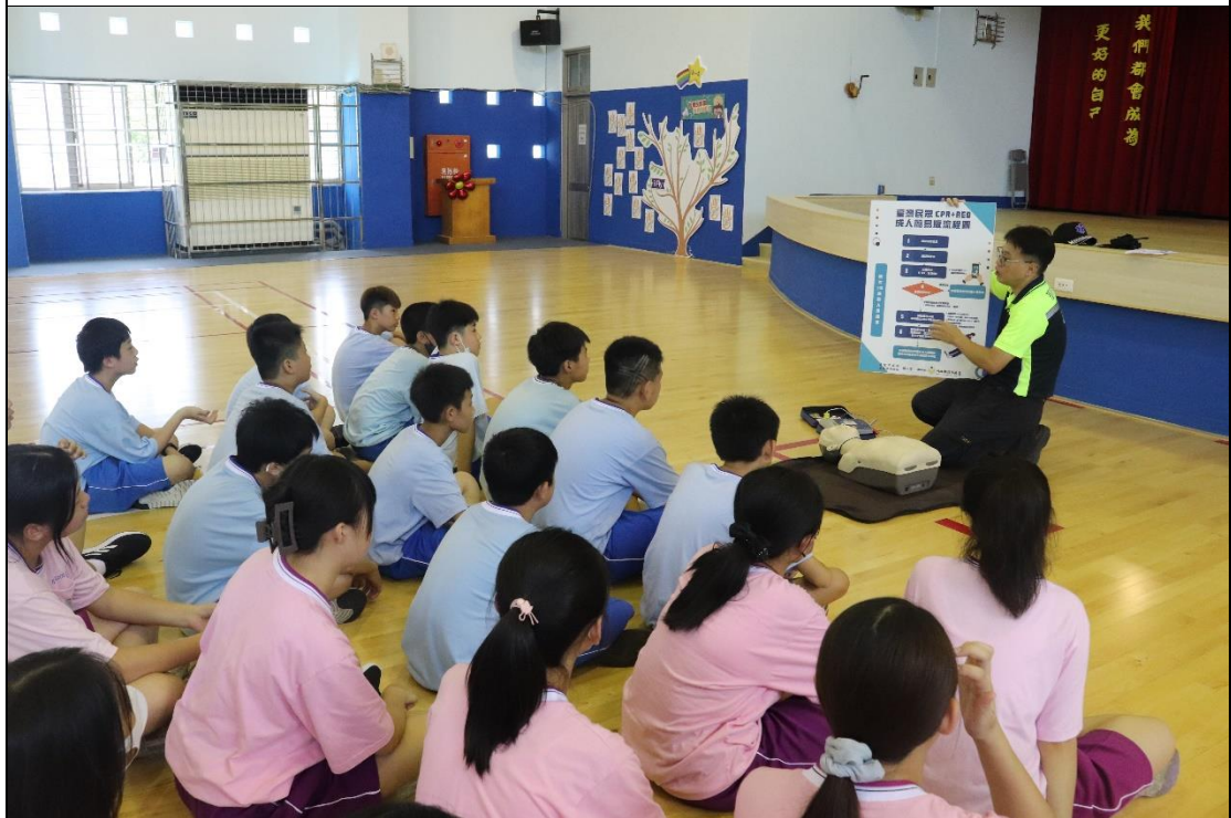
暖暖消防隊支援辦理動態防災教育---AED 示範說明-