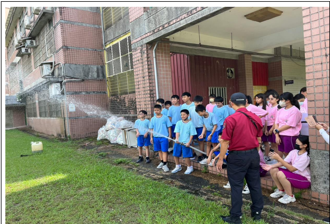
暖暖消防隊支援辦理動態防災教育---消防栓使用介紹