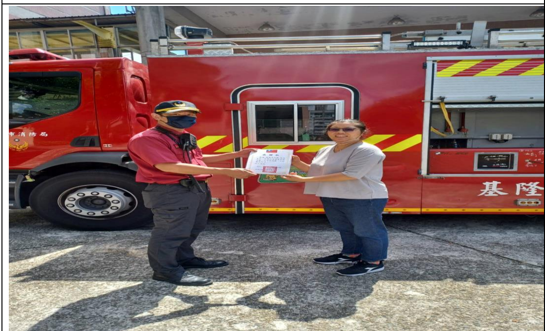
學務主任頒發感謝狀---感謝暖暖消防隊協助支援