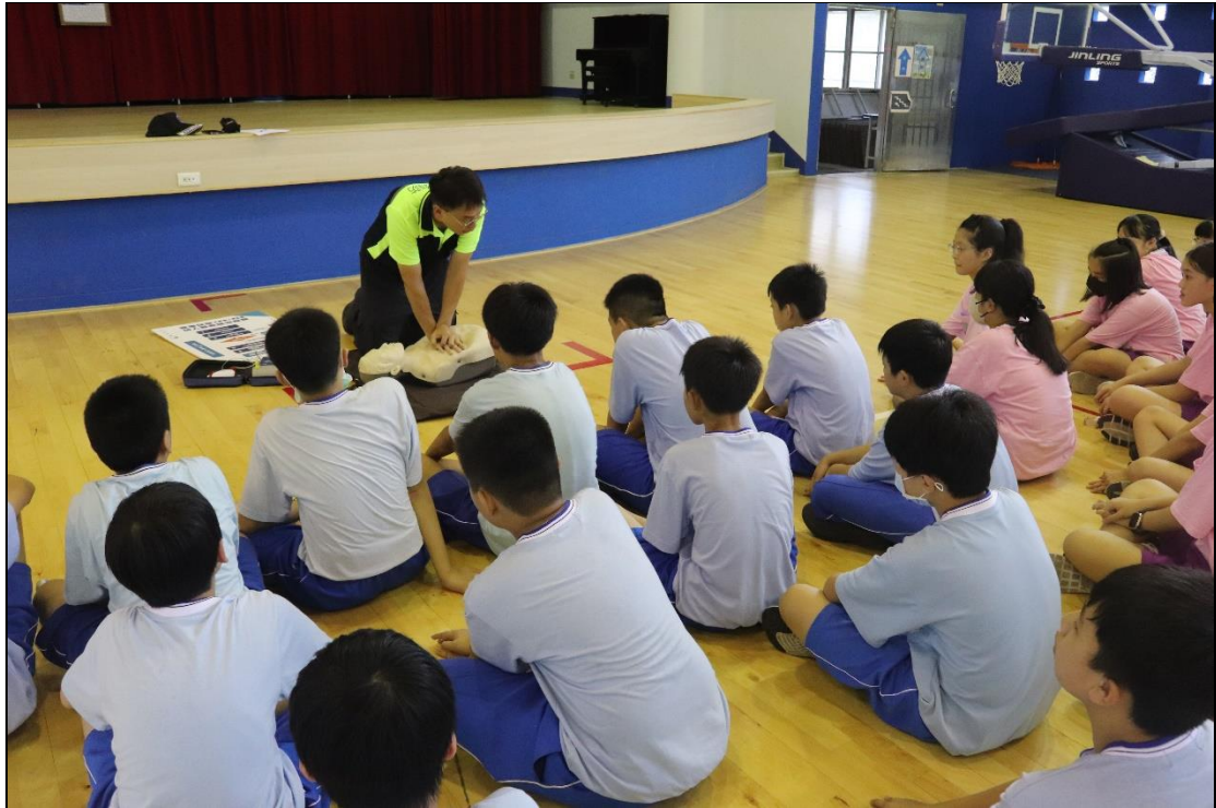
暖暖消防隊支援辦理動態防災教育---CPR 示範說明-