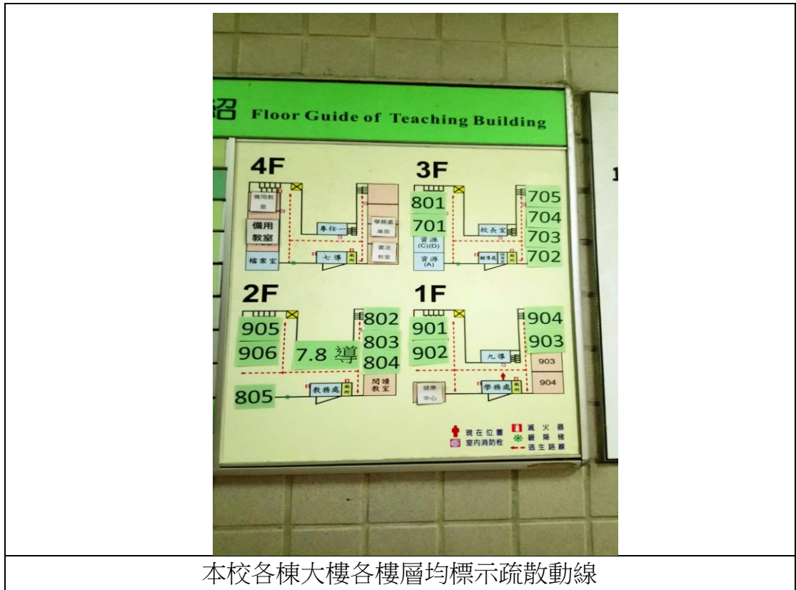
本校各棟大樓各樓層均標示疏散動線