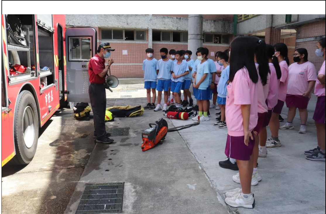
暖暖消防隊支援辦理動態防災教育---消防車設備介紹-