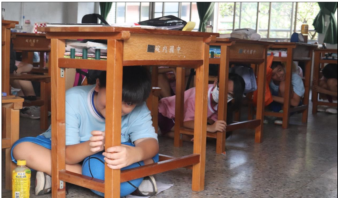
112.9.21 上午 9:21 國家防災日正式就地掩護訓練