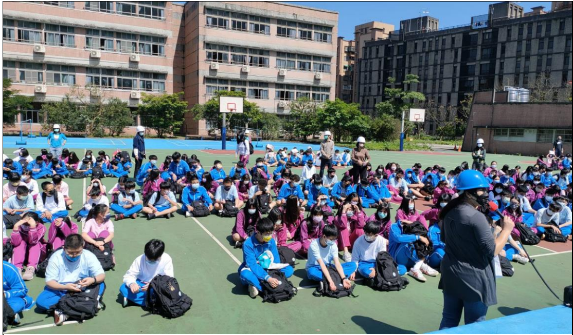
112.9.20 上午辦理第一次避難路線演練