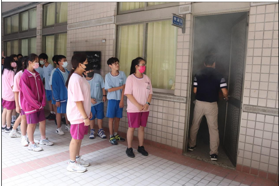
暖暖消防隊支援辦理動態防災教育---體驗煙霧室-