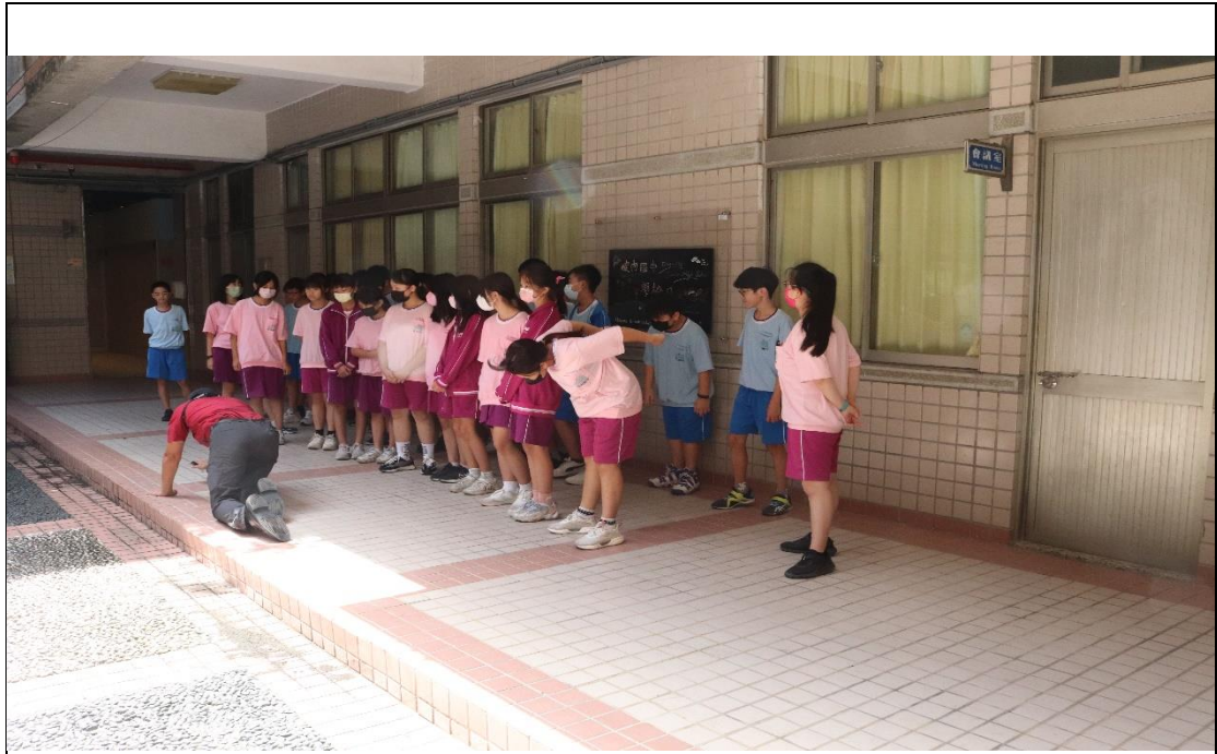
暖暖消防隊支援辦理動態防災教育---煙霧體驗說明-