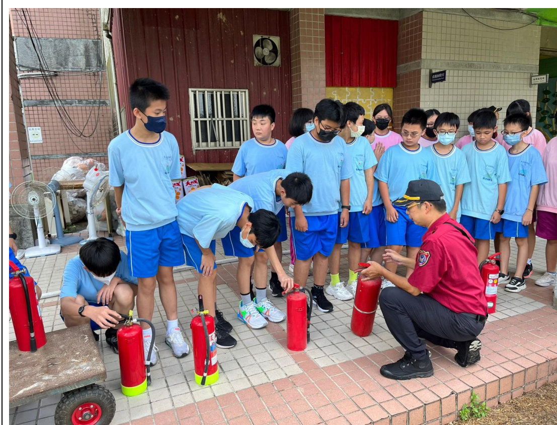
暖暖消防隊支援辦理動態防災教育---滅火器使用介紹