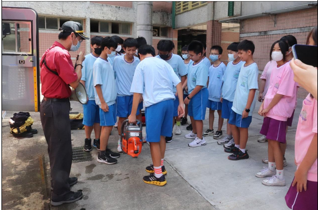
暖暖消防隊支援辦理動態防災教育