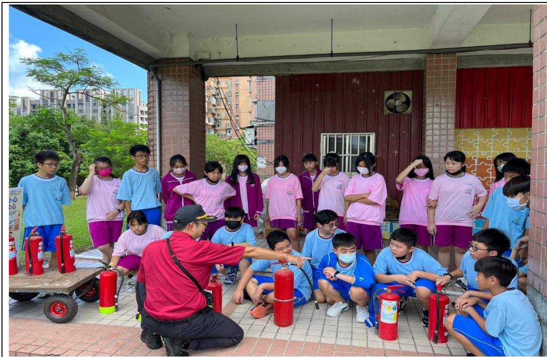
暖暖消防隊支援辦理動態防災教育---滅火器使用介紹