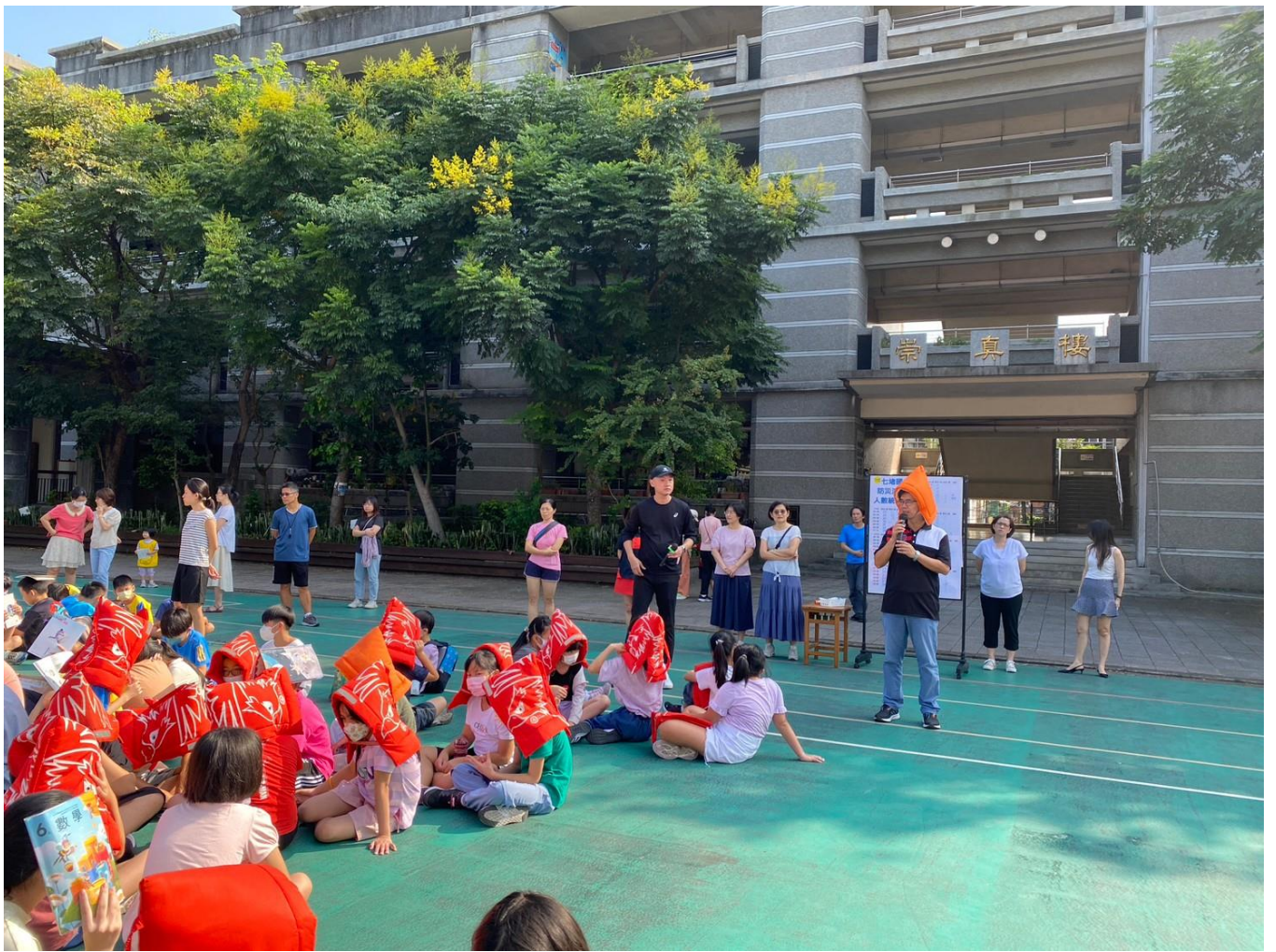
各組回報完畢後，由指揮官提醒、檢討，讓地震防災演練更臻完備