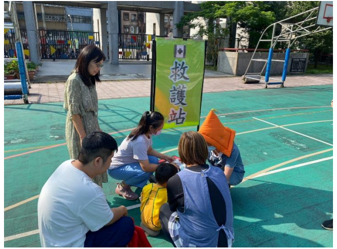
集結、清點、回報全體教職員生人數，傷患包紮及安撫