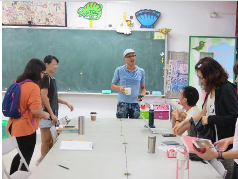
說明：演練之後召開檢討會