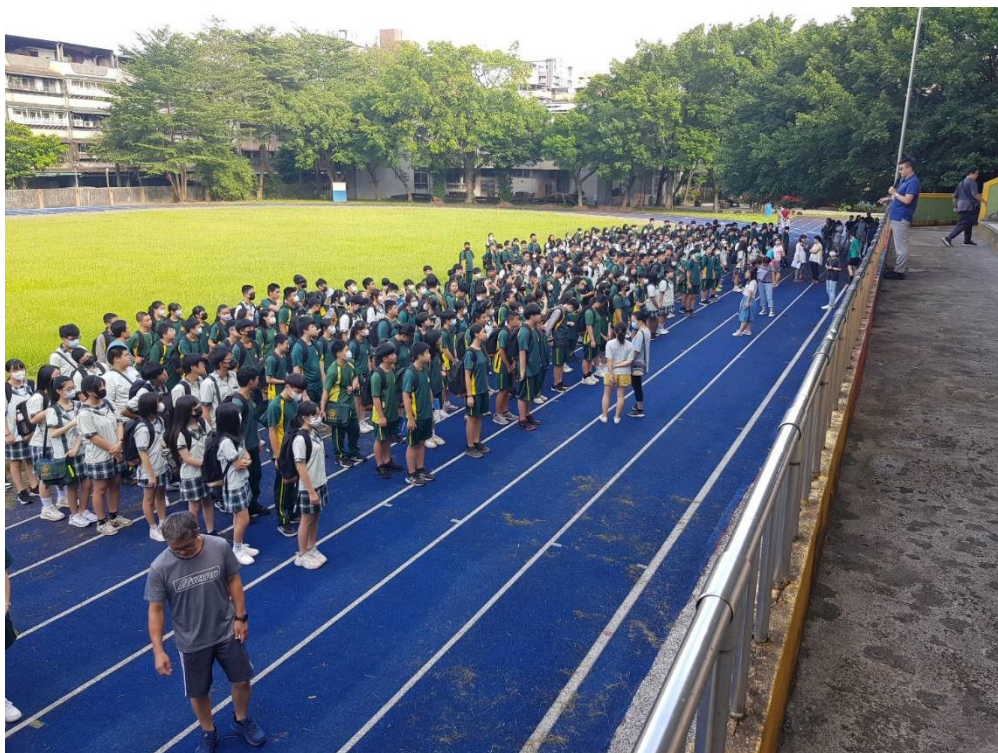
照片四說明：113/09/20 國家防災日演練 就地掩護