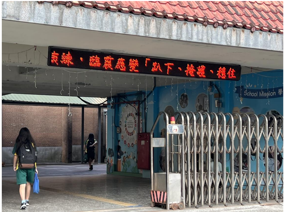
照片八說明：113/09/20 國家防災日接收演練警報