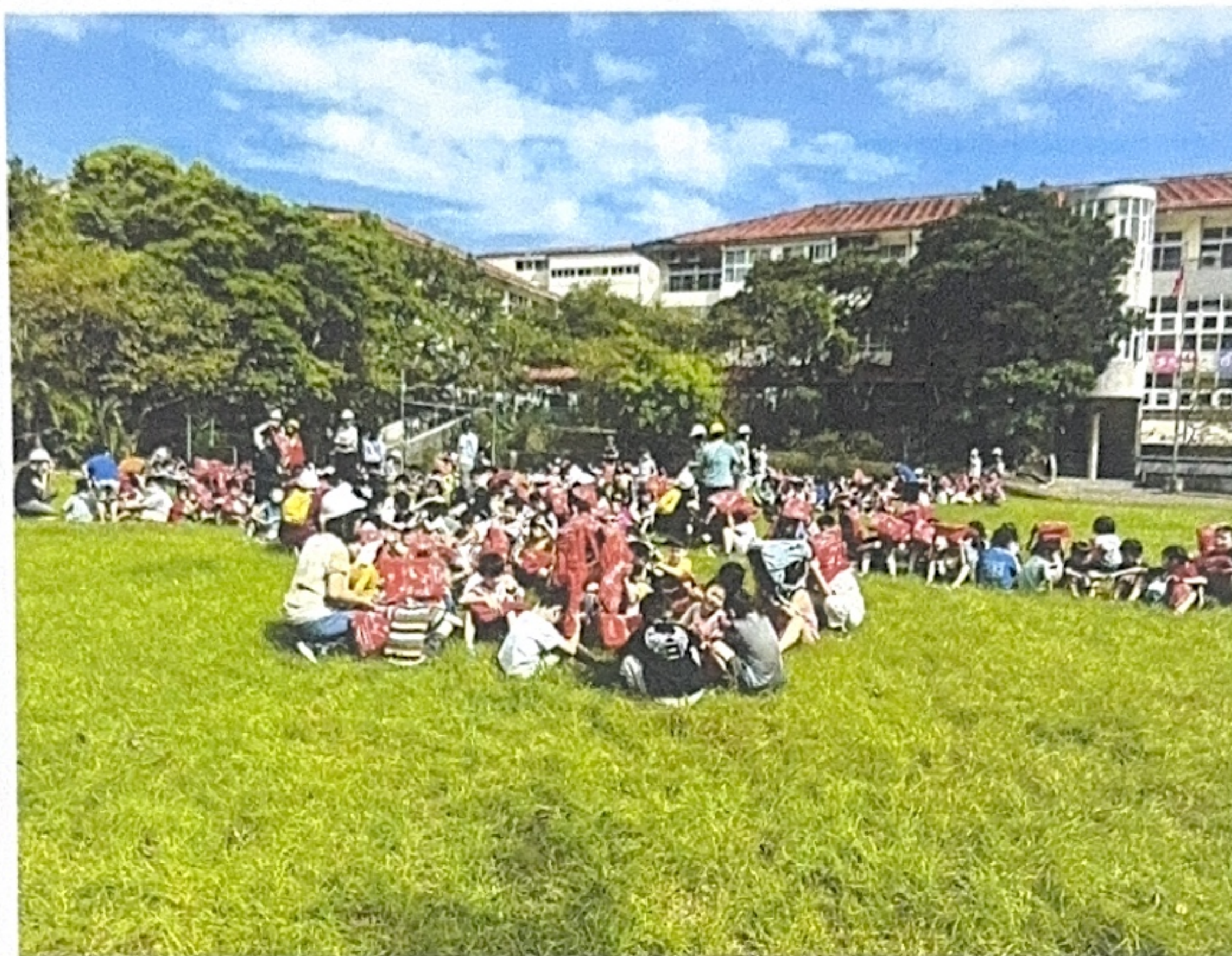
照片八說明：地震後疏散演練-運送傷患。