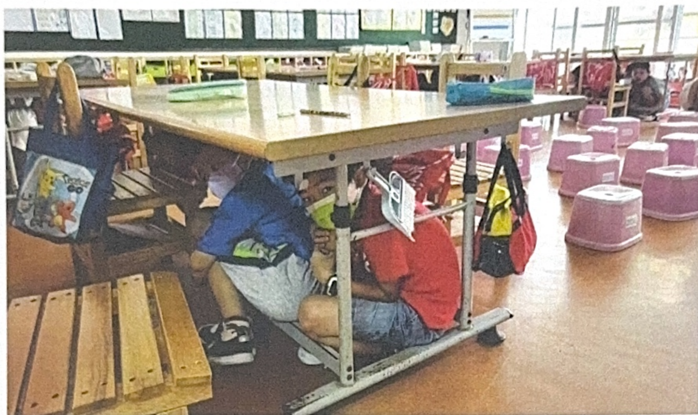
照片四說明：地震後疏散演練