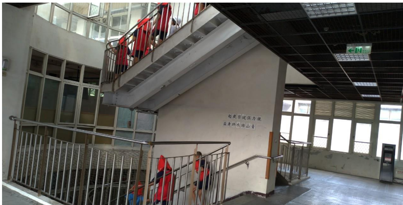
照片六說明：依指定疏散路線至運動場疏散集合