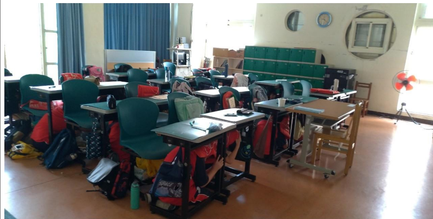
照片四說明：地震狀況模擬（趴下、掩護、穩住）